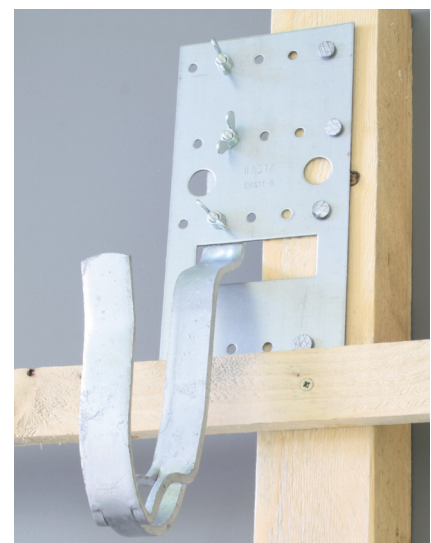
Ortgang rechts Montage links vom Sparren