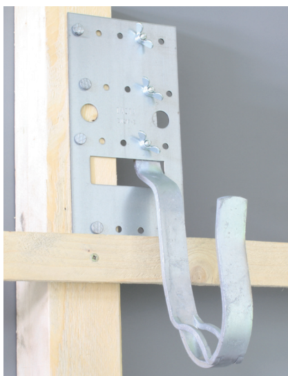
Ortgang links Montage rechts vom Sparren

Bei Biberdeckung für die Aufnagelung der Dachlatte im Bereich der Sicherheitsplatte die 20 mm Lochdurchführung benutzen!