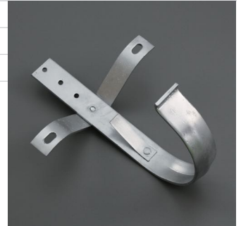
Abbildung: Bügel mit Rinnenhalter montiert