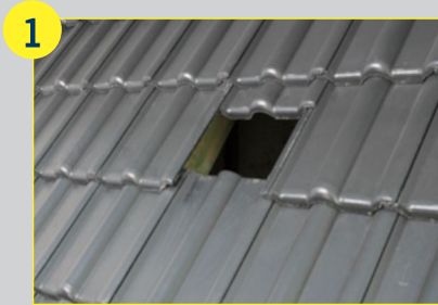
Dachpfanne nach oben schieben